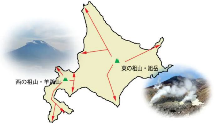
北海道的龍脈ルート

流经北海道的能量(风水中描述的龙)从东西两个草山(整个北海道地区的能量出口)爆发出来。一个是北海道的最高峰大雪山旭岳,另一个是从羊蹄山流向札幌、二世古和北海道南部的龙脉。本次调查的物业 F 位于北海道中部能源路线(龙脉)的发源地羊蹄山东北麓。